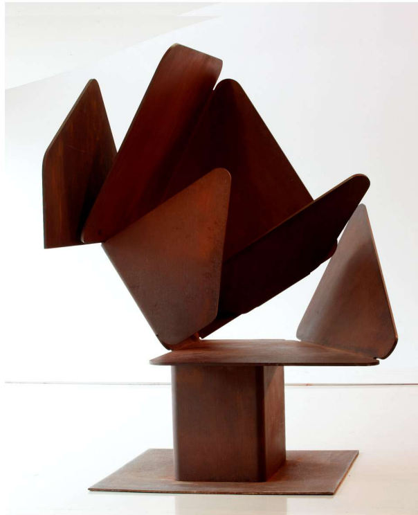
© Pablo PALAZUELO Lauda I, 1981

Las obras de arte mencionadas componen la Colección Aena de Arte Contemporáneo. Desde 1995, la Fundación Aena tiene como uno de sus cometidos, no sólo el de su conservación, sino también el de divulgar la Colección, con cuyo objeto ha organizado exposiciones en la mayor parte de las capitales españolas peninsulares e insulares.