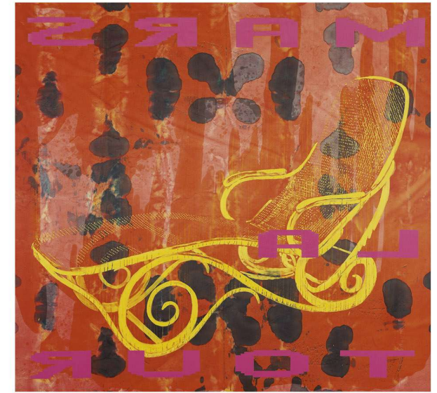
© Xesús VÁZQUEZ Mars Latour, 1992

La muestra se titula Arte en los Aeropuertos , denominación que expresa no solo el permanente intercambio con el exterior, que se canaliza principalmente a través de nuestros aeropuertos, sino también la creciente presencia internacional de nuestros autores y de sus creaciones artísticas.