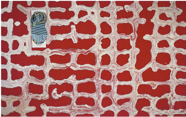
© Juan USLÉ, One Way Trip, 2003

Aena, empresa pública vinculada al Ministerio de Fomento, cuenta dentro de su patrimonio con 1.600 obras de arte contemporáneo español e iberoamericano. Son grandes murales cerámicos y pictóricos, esculturas, pinturas, dibujos originales sobre papel, fotografías y obra gráfica, entre otros soportes, que se encuentran distribuidas en los aeropuertos y el resto de sus instalaciones.