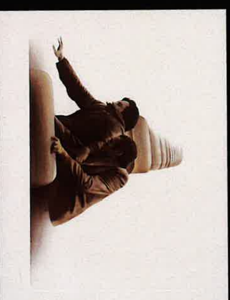
Juan Genovés , Personajes, 1979. Técnica mixta/papel, 42 x 64 cm. Colección Fundación Chirivella Soriano.