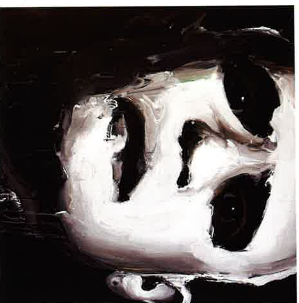
Santiago Ydñez , Sin título, 2000. acrílic/lienzo, 180 x 180 cm. Colección Fundación Chirivella Soriano.