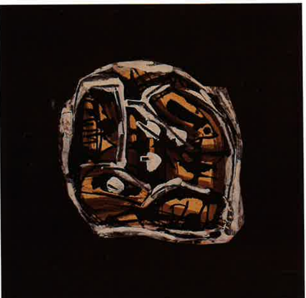
Antonio Saura , Sin título, 1961. paper/cartón, 40 x 40 cm. Colección Fundación Chirivella Soriano.