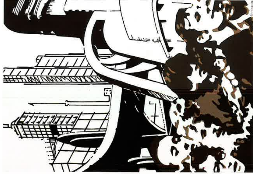
Equipo Realidad , Sin título, 1970. Técnica mixta/papel, 67 x 46 cm. Colección Fundación Chirivella Soriano.