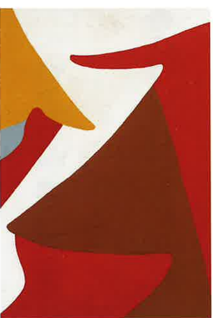
EQUIPO CÓRDOBA, Sin título , h. 1960 Acrílico sobre tabler. 55 x 38 cm. Colección particular

sols per la impossibilitat de localitzar totes les obres que lla-vors es van exhibir, sinó també per no ser eixe el nostre pro-pòsit de partida, perquè, com s'apreciarà, la nostra intenció ha sigut mostrar un esdeveniment històric en les seues coor-denades històriques i culturals.