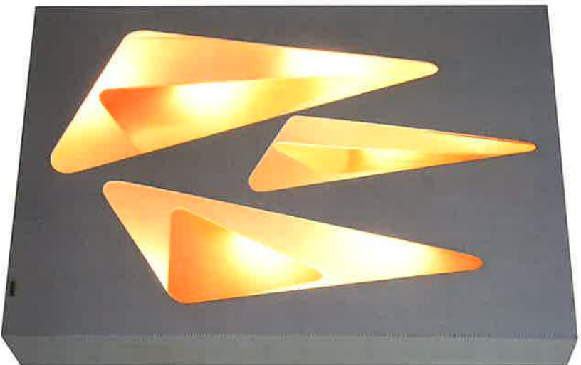
EUSEBIO SEMPERE, Relieve luminoso móvil , 1959 Madera, acrílico, plástico, lámparas incandescentes y motor de corriente alterna. 80 x 55 x 14,5 cm. C.A.C Zara España, S.A. - Museo Patio Herreriano, Valladolid