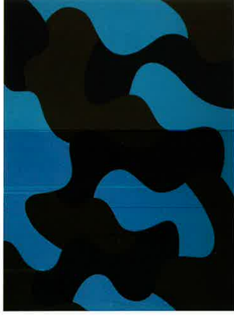
EQUIPO 57. Sin título, 1960 Óleo sobre tela. 81 x 100 cm. Colección de los artistas

Según palabras del propio Aguilera Cerni: "Para comprender lo normativo se parte de la consideración del arte como actividad humana. La actividad humana ha de ser intencionada y voluntaria y en esas condiciones se dan, se ha asumido una responsabilidad. El arte normativo es un arte responsable. Y se le da la referencia a una norma porque la profundidad, velocidad y extensión de los cambios que se producen en nuestra época imponen como norma lo expe-