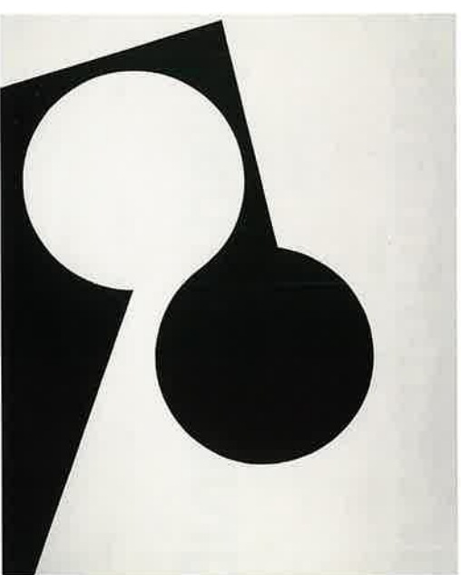
MANOLO CALVO, Los amantes , 1960 Acrílico sobre lienzo. 130 x 162 cm. Colección del artista

L'exposició que ara pot veure's no pretén ser una recons-trucció fidel de la celebrada a València fa cinquanta anys. No